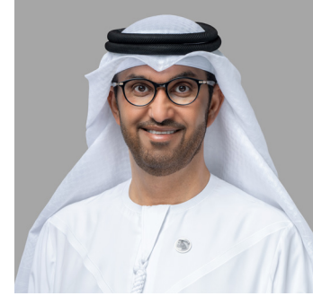
معالي الدكتور سلطان أحمد الجابر رئيس مجلس الإدارة